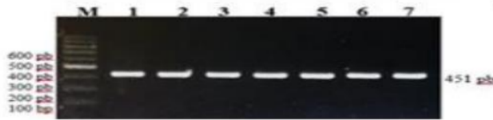
Gambar 2. Hasil amplifikasi PCR ekson 3 gen MSTN